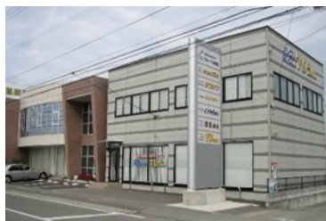
【四国進学会藍住校】

● 施設見学会 令和 7 年 4 月 8 日 ㊞ ～5 月 13 日 ㊞ 9 時～12 時の間で随時 (事前に電話連絡の程、お願いします)